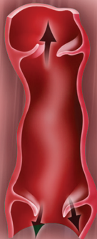
單向瓣膜出現問題，導致血液倒流

靜脈是體內血液循環系統的一個重要部份。當動脈將血液供應至身體各部位後，靜脈則將血液送回心臟。如靜脈內的單向瓣膜出現問題，導致血液倒流及循環欠佳，靜脈便會變得脹大及扭曲，出現靜脈曲張，俗稱「浮腳筋」。