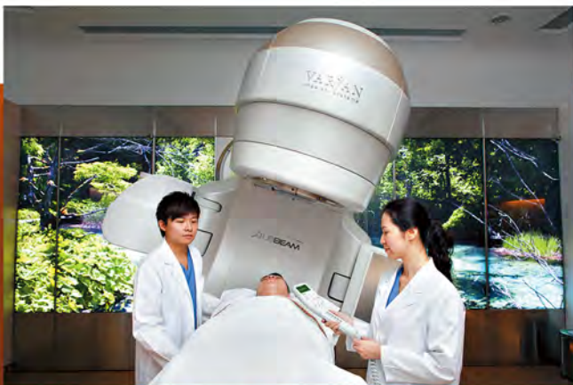
▲ 為了降低復發率，乳癌病人在術後或需要接受電療。

腫瘤，這情況有兩個可能性，一是乳癌擴散至卵巢，二是原發卵巢癌，但前者機會較微，因為患者正接受化療中，如果是乳癌擴散，卵巢的腫瘤都應縮小，除非它是抗藥性腫瘤。故我們安排病人接受正電子掃描，結果發現有癌細胞，需要進行切除卵巢手術，同時一併切除子宮及輸卵管。」譚醫生解釋。