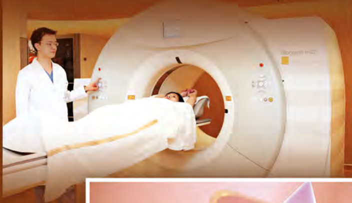
▶ 在監察期間，如有懷疑病變，婦女或有需要進行影像掃描。