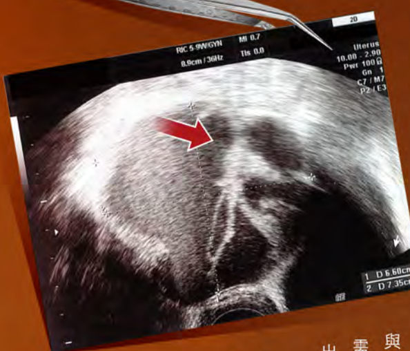
▲ 圖為楊女士的超聲波影像掃描，顯示右邊卵巢出現病變。