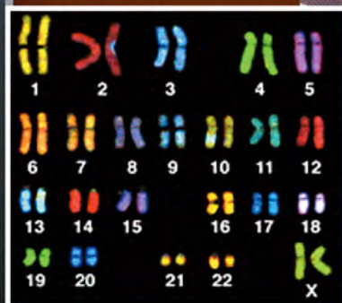
▼ 擁有BRCA基因的女性，患乳癌及卵巢癌機會比一般人高。

係密切。他解釋：「部分乳癌患者帶有遺傳基因，根據香港遺傳性乳癌家族資料庫數字顯示，接受基因檢測的乳癌高危人士中，大約十分之一攜帶乳癌基因BRCA1或BRCA2，這群人除了有百分之三十三至七十五機會患乳癌外，罹患卵巢癌機會為百分之十至百分之五十一。所以有乳癌基因的女士，除了要對乳癌提高警覺外，同時要特別提防患卵巢癌。」