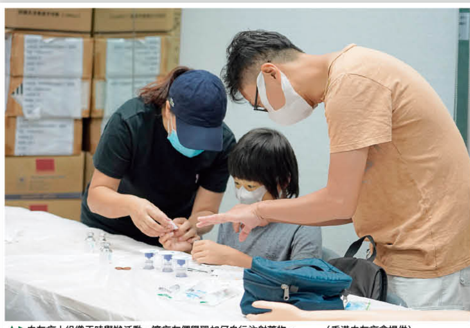
▲▶血友病人組織不時舉辦活動，讓病友們學習如何自行注射藥物。

(X-linked recessive inheritance)。他解釋，女性有兩條X染色體，男士則是一條X一條Y染色體，如果媽媽的兩條X染色體中有一條帶有疾病基因，由於她有另一條X染色體可以修正，所以不會發病，除非因特殊情况引致發病，否則她只是一個疾病基因攜帶者。 如果她的配偶是健康人士，沒有攜帶疾病基因，X及Y染色體都正常，他們的後代有四個可能性：第一個可能性，是誕下的兒子遺傳了媽媽帶病基因的X染色體，由於沒有正常的X染色體幫助修復，他就會帶有疾病基因並會病發；第二種情況是誕下兒子，他遺傳了媽媽正常的X染色體，及爸爸健康的Y染色體，他就沒有遺傳到疾病；第三種情況，是女兒遺傳了媽媽不正常的X染色體及爸爸的正常X染色體，她就會成為疾病基因攜帶者，但不會發病，因為她有另一條來自爸爸的正常X染色體修補缺損；第四種情況，是女兒從爸