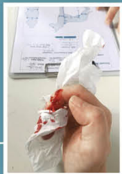
▶血友病患者如有外傷會流血不止。

重度： 凝血因子濃度低於正常人的1%，一個月內可數次出血，甚至經常無緣無故出血，關節出血普遍。