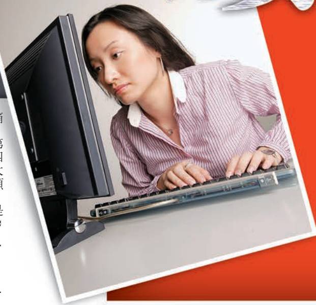
▶工作入神，身體不自覺向前傾，會令頸椎受壓，造成痛楚。