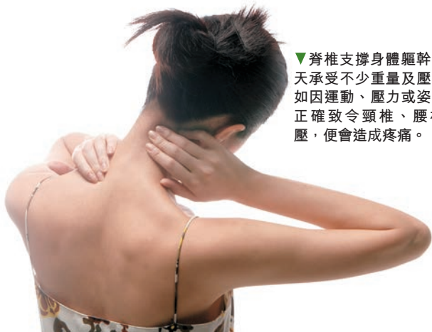
▼脊椎支撐身體軀幹，每天承受不少重量及壓力，如因運動、壓力或姿勢不正確致令頸椎、腰椎受壓，便會造成疼痛。

Psychosomatic 痛症，而這些痛楚，悄悄的一直追隨着她。 找出原因後，醫生會處方令人安睡及舒緩肌肉緊張藥物。然而藥物只是治標，如根本問題沒解決，病人最終又會再次出現痛楚而求醫。 同樣道理，在工作中或生活中飽受壓力人士如找不到紓壓途徑，辦公室痛症一群，每天仍保持七八個小時扭着頸打電腦鍵盤，如不糾正姿勢，不給自己伸展機會，最終被扯住的肌肉繼續被拉扯，被壓住的頸椎及腰椎繼續受壓，打針服藥紓緩了的痛楚，最終仍然會再現，而且問題只會愈來愈嚴重。