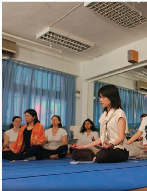
冥想是一種紓壓方法，學習者可以通過調節呼吸，讓身體放鬆下來。

而另一種經常聽見的肌肉纖維化而引發的肌肉痛，是指過分使用、拉扯而令肌肉纖維化，因而變硬及失去彈性。纖維化的肌肉可讓人久坐而不覺得疼痛，但會令身體肌肉失去彈性，影響血液循環，增加關節壓力。纖維化的緊張肌肉會造成韌帶和肌腱的鈣化，最後形成骨刺。骨刺和失去彈性的肌肉讓關節承受不正常的