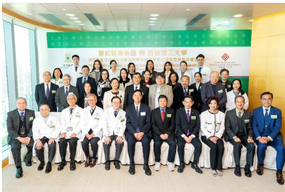
5. 養和醫療集團與香港理工大學簽訂專業培訓合作協議全體嘉賓合照。

Department of Food Science and Nutrition 食品科學及營養學系